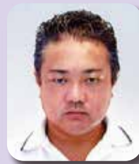
旭 始 H22.8月入会