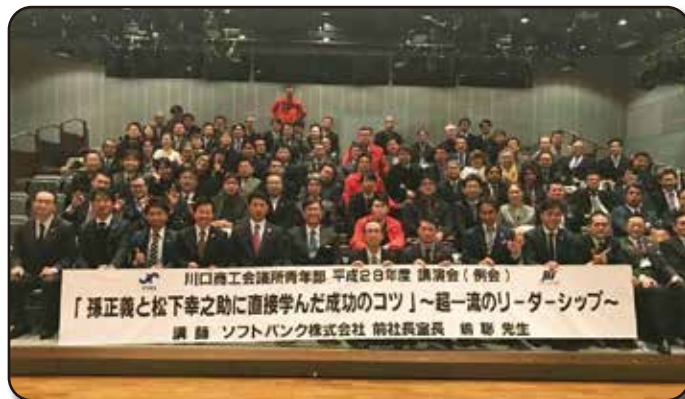
2月／講師例会(経営開発委員会)