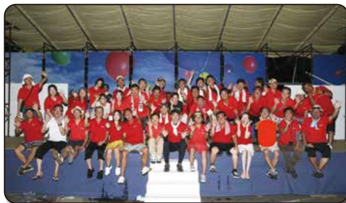
8月／たたら祭り(市民対外交流委員会)