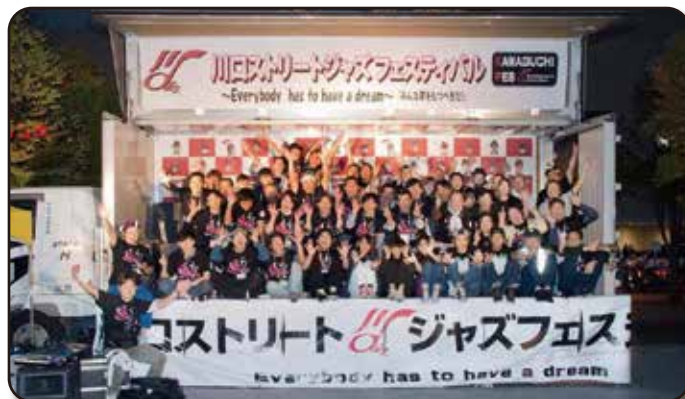
10月／30周年記念事業川口フェス(地域活性化委員会)