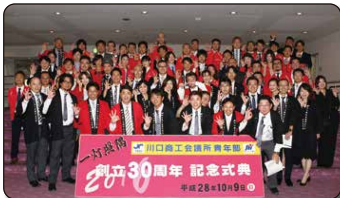
10月／30周年式典・祝賀会(30周年事業実行委員会)