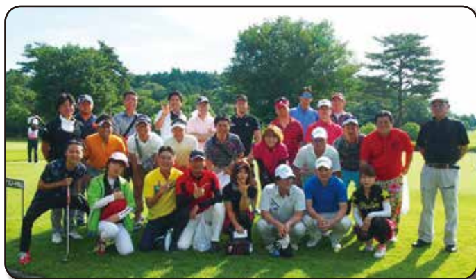
6月／若企会(会員交流委員会)