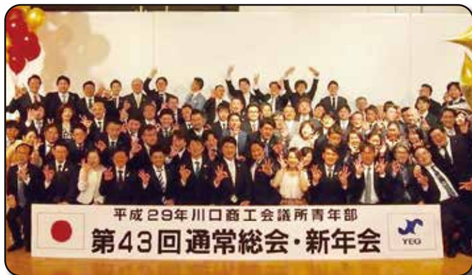
1月／第43回通常総会・新年会(総務広報委員会)